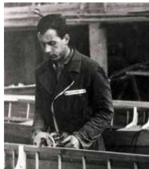
Aldo Cranchi 1961年