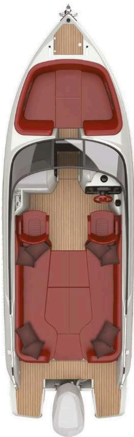
MAIN DECK SUNBED